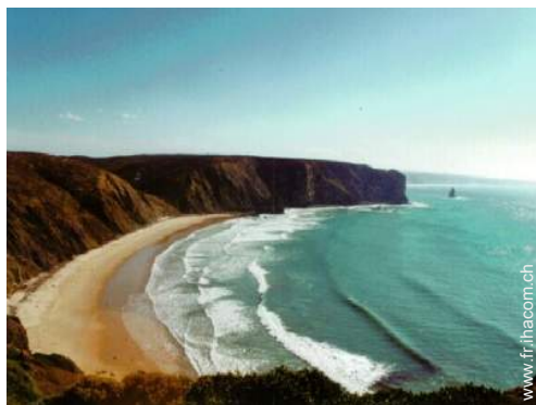
spot de surf