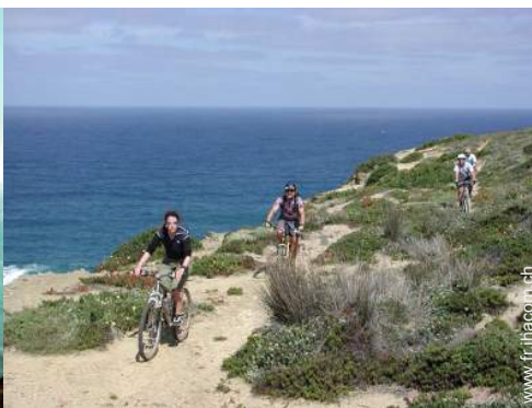
VTT (itinéraire circuit)