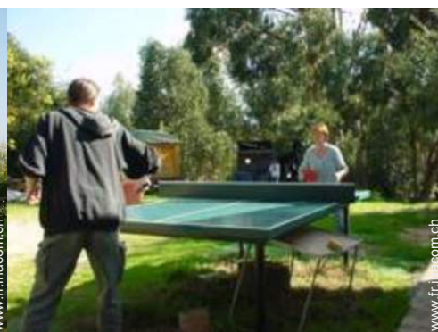
table de ping-pong