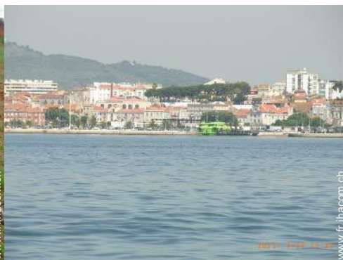
loisirs balnéaires à proximité